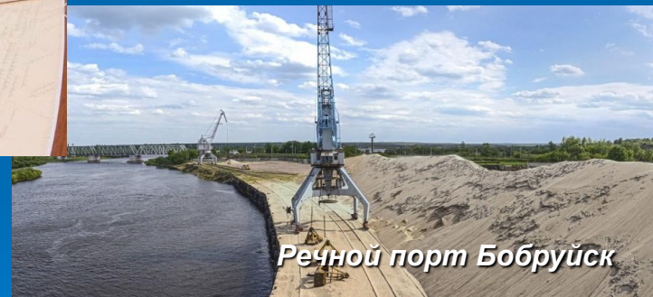
Речной порт Бобруйск