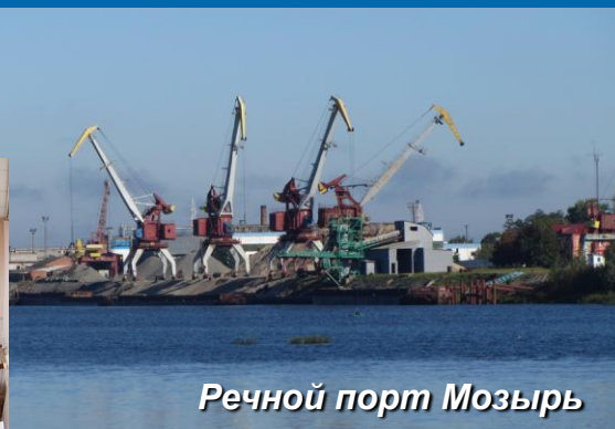
Речной порт Мозырь