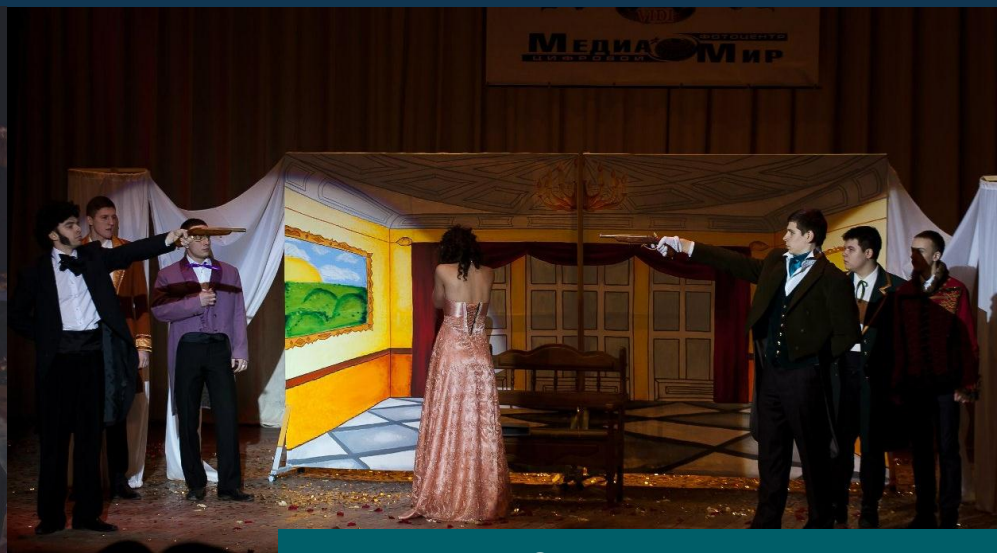
Турнир «За прекрасных дам»