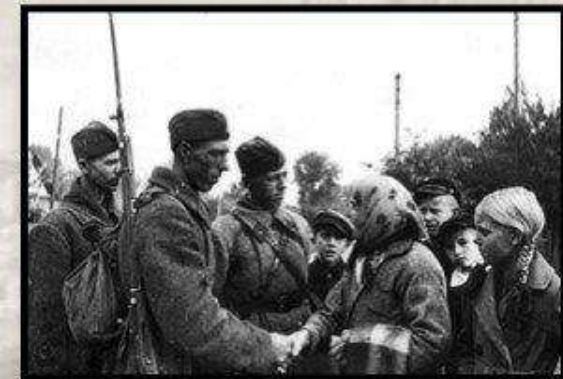
Встреча Красной Армии жителями г. Молодечно