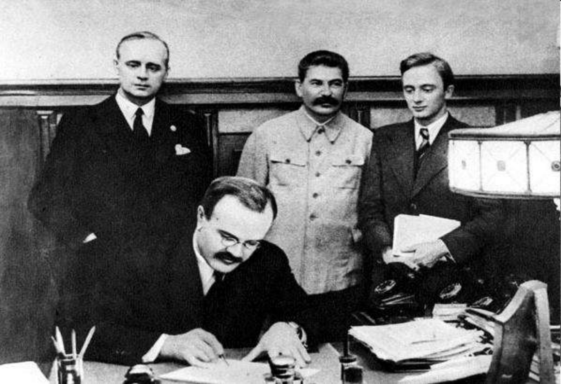
Молотов подписывает договор, за ним Риббентроп, справа И. Сталин