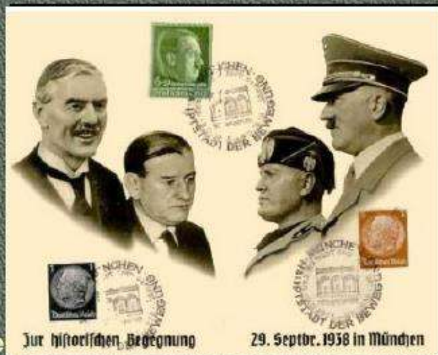
Немецкие памятные почтовые марки по случаю соглашения в Мюнхене.