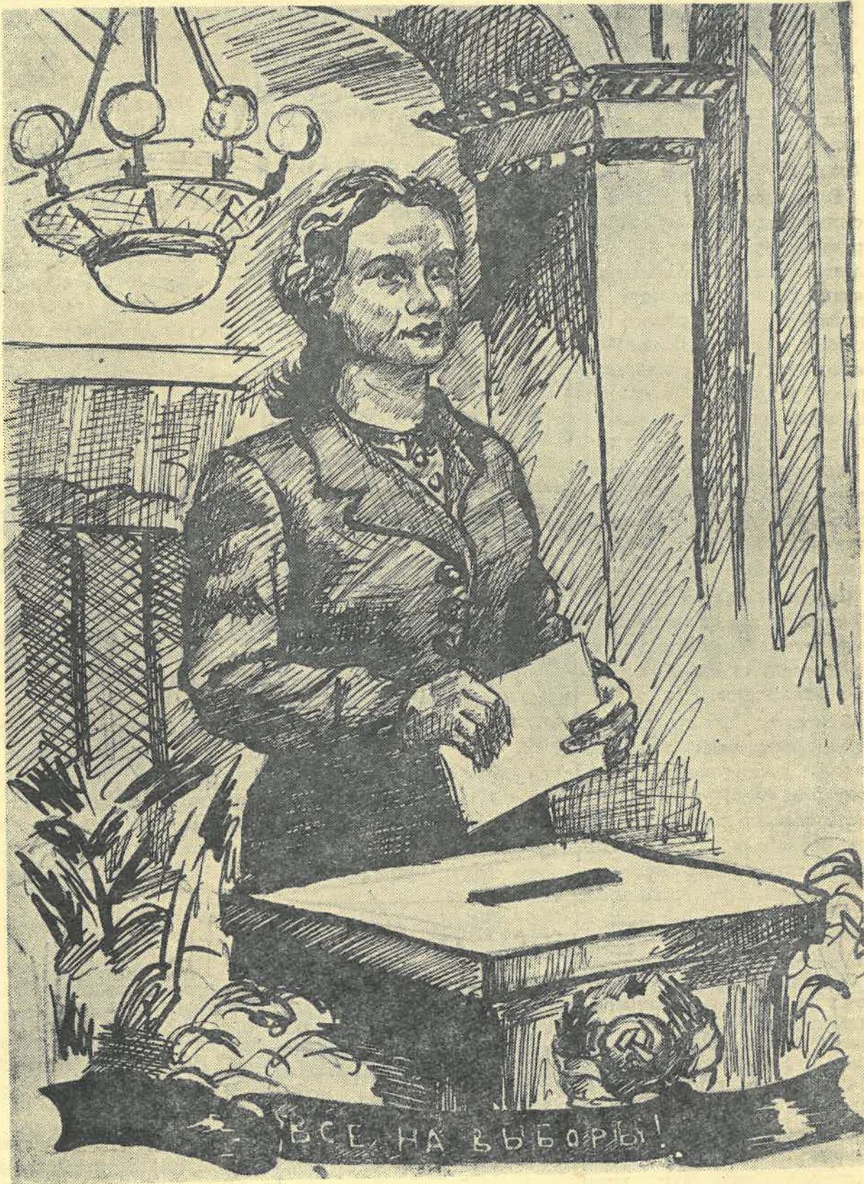
Рис. В. Халатова.

В тебе слились, как в самом лучшем сплаве, Все начертанья будущих побед; Ты можешь не заботиться о славе— Подобной славе—равной в мире нет. И перед восхищенной планетой, Взяв старт на станции «Социализм», Ты мчишь семиступенчатой ракетой, Имея цель—планета Коммунизм!