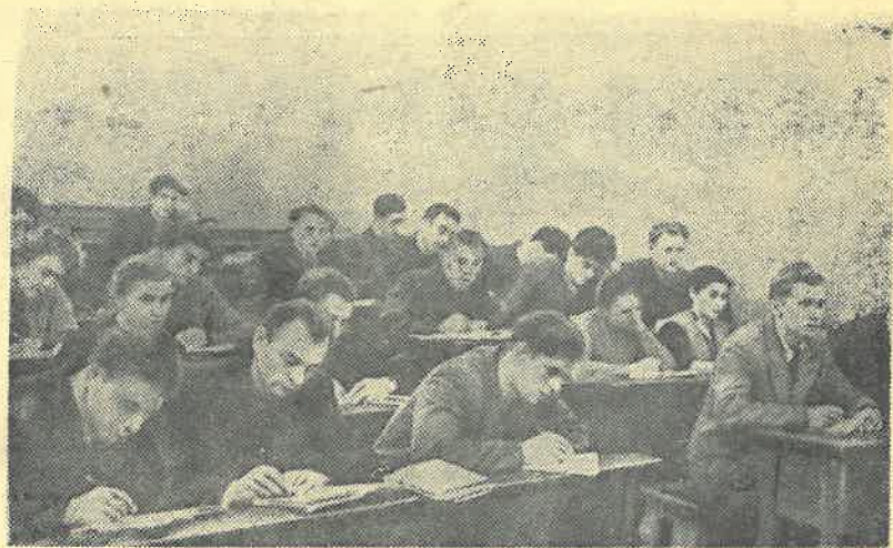
Многолюдно бывает вечерами в аудиториях и лабораториях института. Их заполняет молодежь, которая решила получить высшее образование без отрыва от производства.

На снимке: студенты-вечерники на лекции.