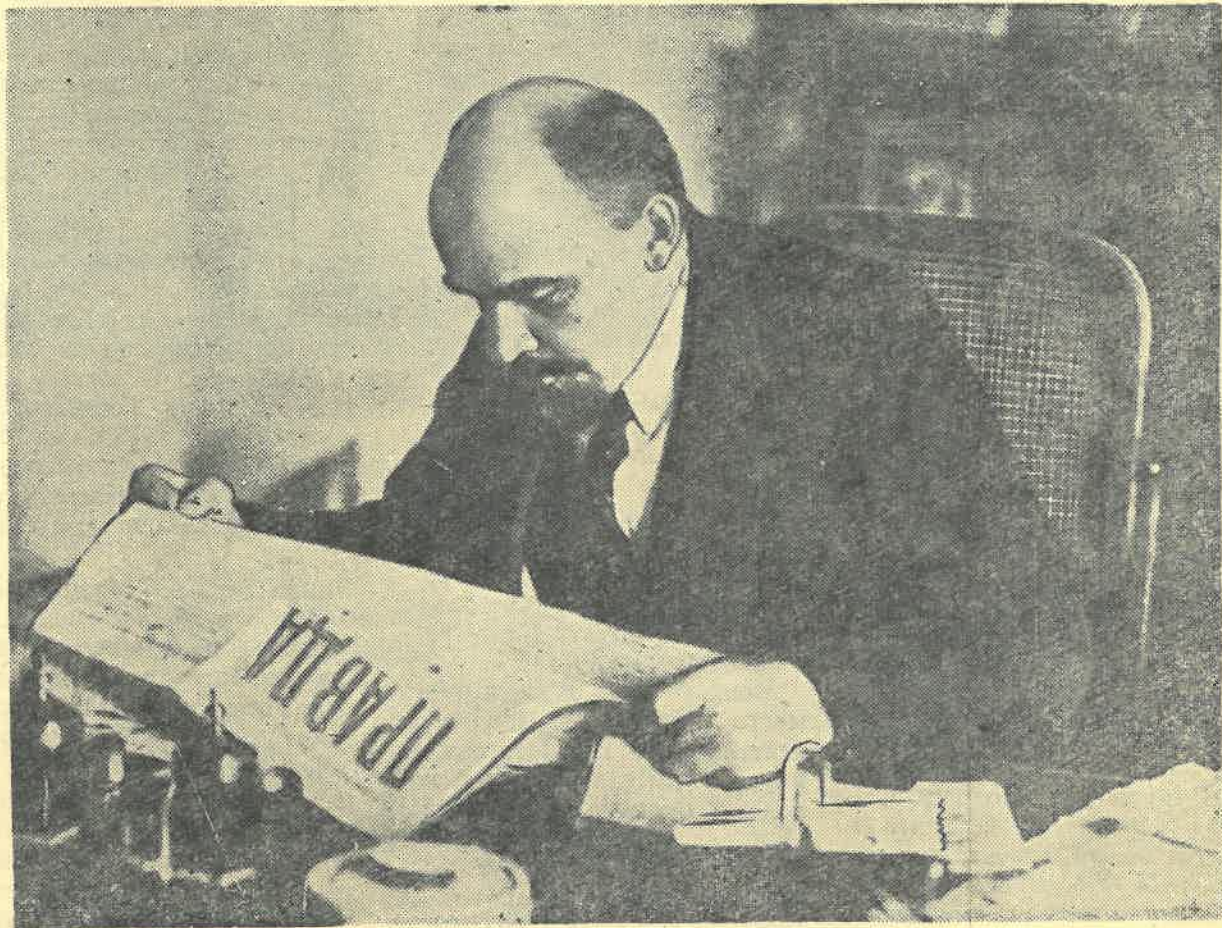
Владимир Ильич Ленин