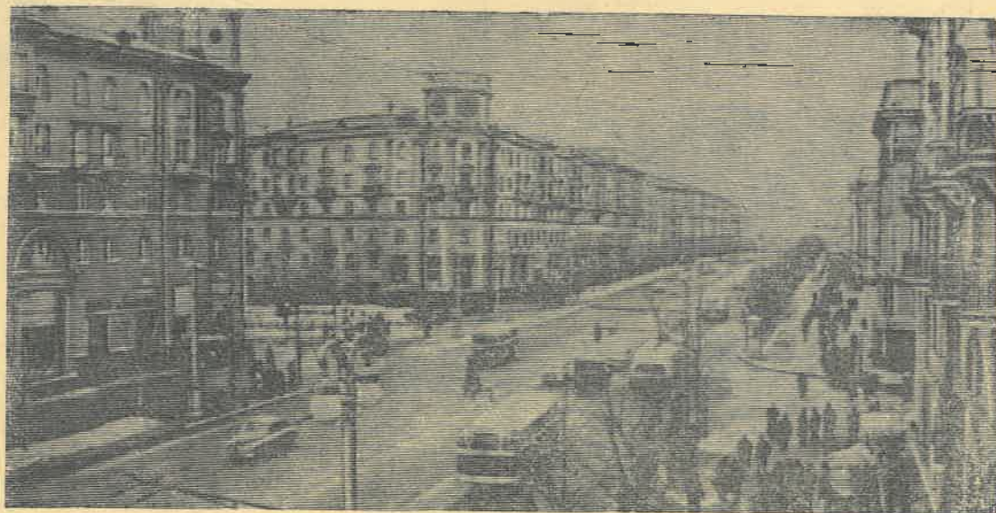
Проспект имени Сталина в столице республики Минске.