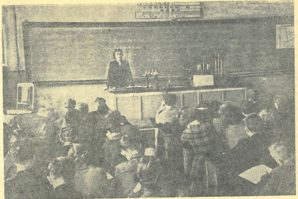
Начался новый учебный семестр. Студенты хорошо отдохнув на каникулах, снова приступили к основной своей обязанности — учебе. На снимке: студенты слушают лекцию по химии доцента З. И. Беловой.