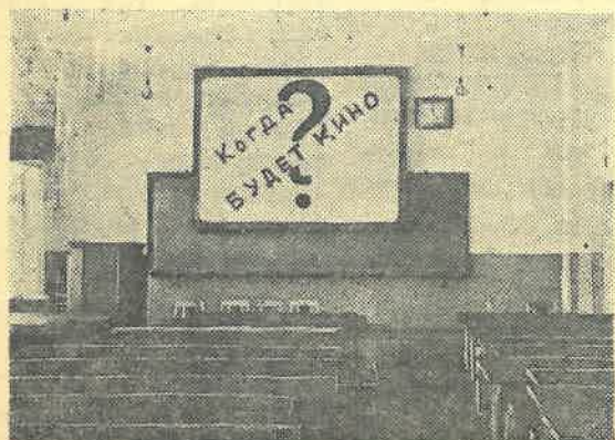
Ждем ответ на этот вопрос.