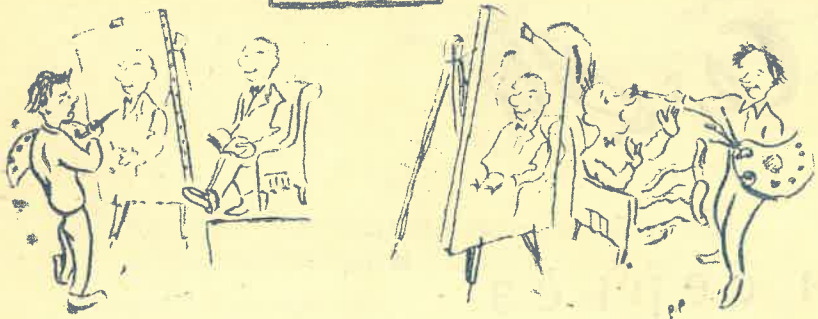
Удачный портрет (Изошутка)