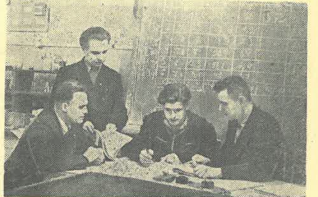
Защита технических отчетов по производственной практике.

Необходимо отметить выявленные в процессе прохождения практики недостатки. Например, некоторые студенты, добросовестно и с интересом работая на производстве, начина-