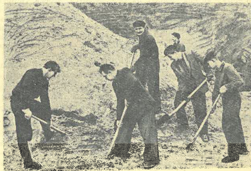
Студенты нашего института на строительстве телестудии города.

Теперь же, поработав полмесяца на подстанции, студенты