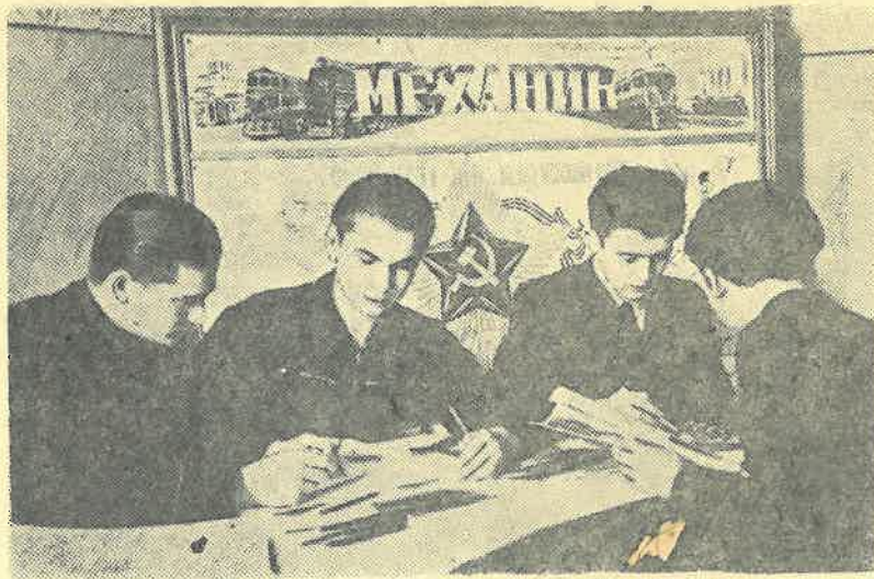
Студенты за выпуском газеты «Механик».

Чтобы здание выполнило свои функции, недостаточно иметь ценные материалы: для этого их еще необходимо сложить в определенном порядке.