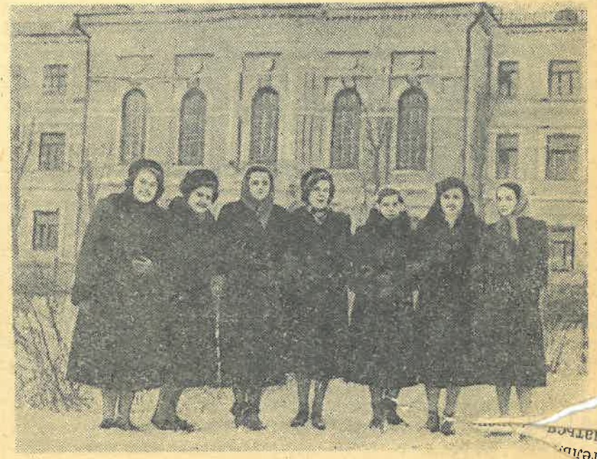
На снимке: группа девушек-студенток в часы отдыха.