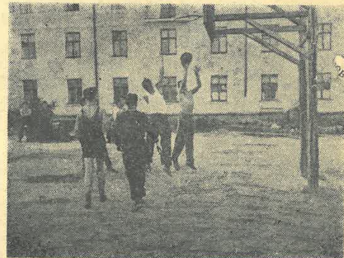
В свободное от занятий время студенты строительного факультета любят поиграть в баскетбол на своей спортплощадке.