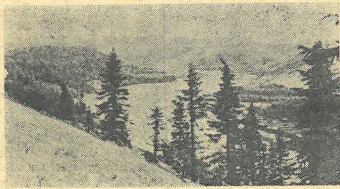
—Урал. Вид на реку Чусовая.