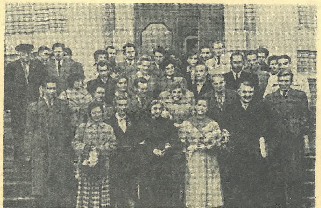
На прощанье мы сфотографировались.

Текст Докторовича, студента 3-го курса механического факультета.