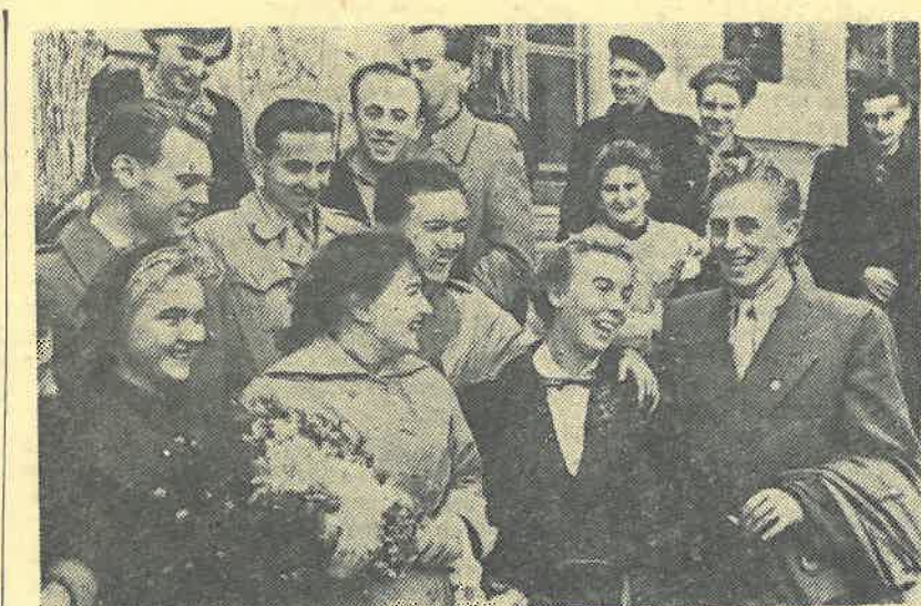
На снимке: студенты нашего института и гости из Варшавского университета.

сил я у него. — Ведь у вас, в Польше, наверно, больше распространена абстрактная живопись.