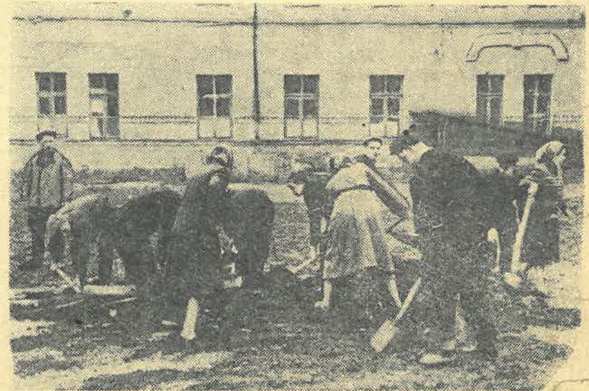
Механики — первокурсники получили задание привести в порядок двор института.