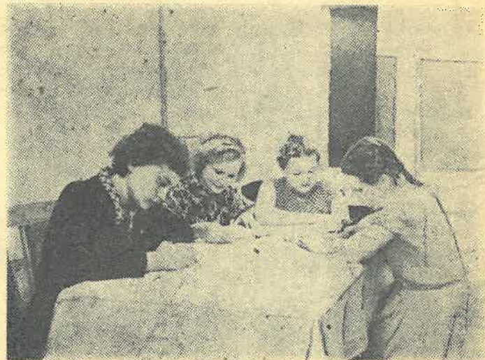
На снимке: студентки первого и третьего курсов строительного факультета за подготовкой к семинарским занятиям.