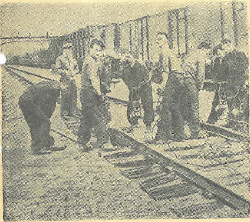
На снимке: студенты 2-го курса эксплуатационного факультета производят подбивку шпал электрошпаловыми подбойками.