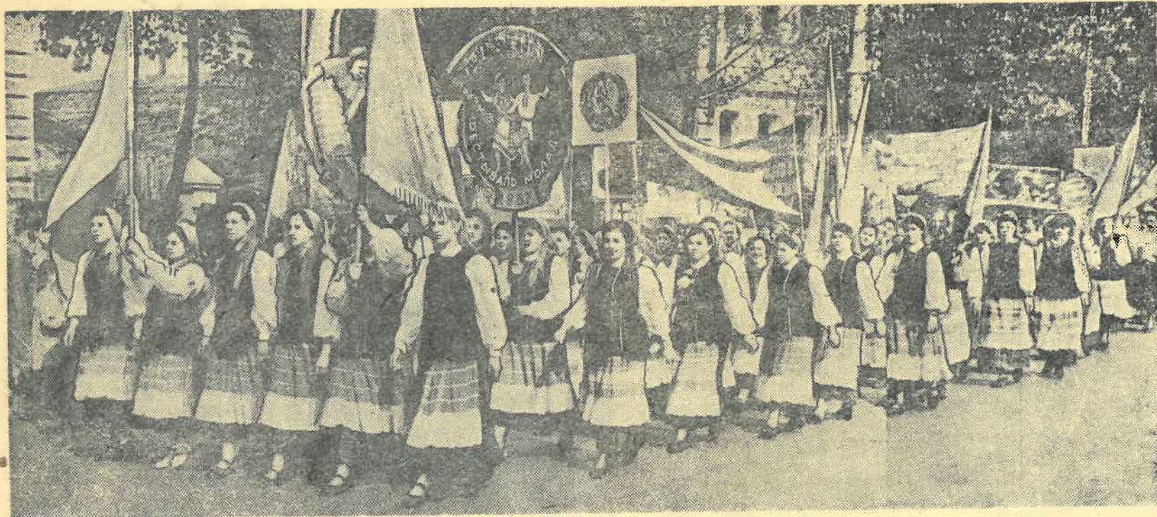
На снимке: участники 1-го областного фестиваля молодежи.