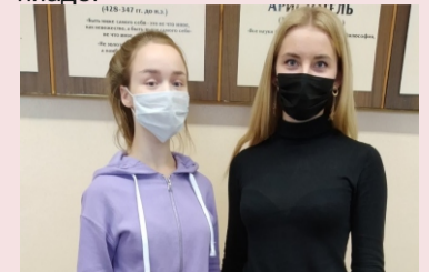
(Подготовлено по информации сайта университета)