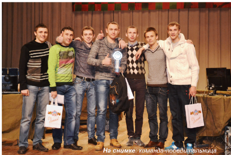
На снимке: команда-победительница

...Ну а итоги турнира таковы. Победителями финала Кубка Республики Беларусь по киберспорту «Гомель-2014» стали парни из команды «13» (БелГУТ), серебро в упорной схватке досталось «танкистам» из ТОЕ (БелГУТ). Тройку призеров замкнул «ТАНКОБАР». Все они получили призы от Министерства обороны, а также от компании-