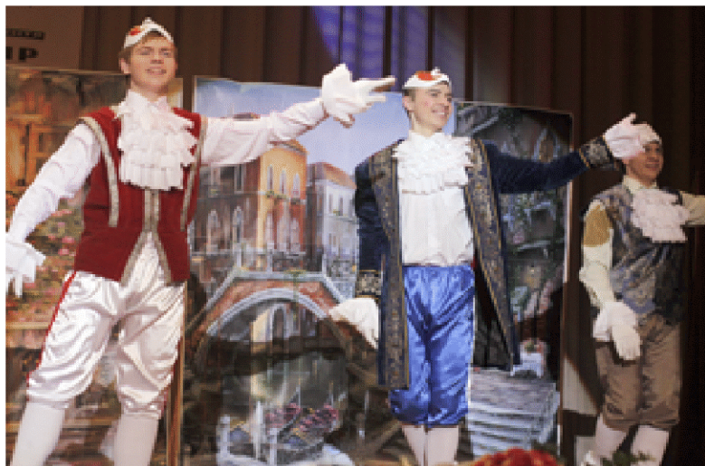
Можно сказать, что рыцарский турнир "За прекрас-

ных дам" – это уникальное явление в нашем универси-