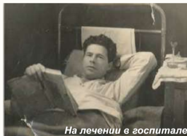
На лечении в госпитале

войне именно в составе 1-го Белорусского фронта в пушечной артиллерийской бригаде. Командиром батареи был назначен в 1944 г.