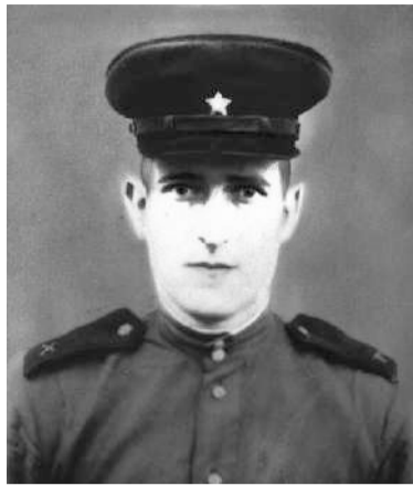
Партизаны не давали покоя немцам, а те, в свою очередь, постоянно